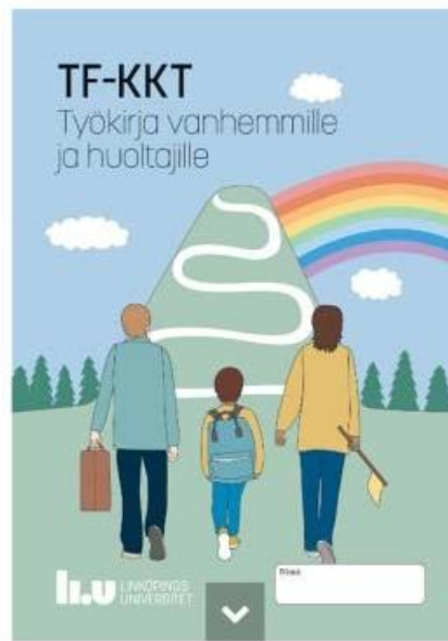
Kuva 3. TF-KKT työkirjat.

Kansallisia implementaatio-suunnitelmia rakennettaessa on hyödynnetty muun muassa ITLAn interventio- ja implementaatio-osaamista 7 . Käytännössä tämä on tarkoittanut esimerkiksi implementaation tueksi suunnitellun NOMAD-instrumentin hyödyntämistä koulutuksissa 8 , sekä koulutettavien esimiehille tarkoitettujen implementaatiopäivien järjestämistä osana TF-KKT -koulutuksia. Saatu palaute kentälle ohjatusta implementaation tuesta on ollut hyvää ja vastaavaa mallia hyödynnetään myös muiden terapeuttisten työmenetelmien osalta.