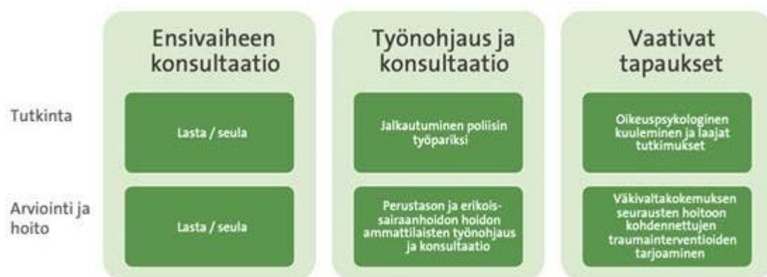
Kuva 6. Lasten ja nuorten oikeuspsykologian ja -psykiatrian yksiköiden (Barnahus-keskusten) mahdollisia tulevaisuuden tehtäviä (kuva julkaisusta THL raportti 17/2020).

Vuosina 2019-2021 hoitoon liittyvä asiantuntemus on hankkeen koulutusten (TF-KKT, CFTSI, CPC-CBT) ja resursoinnin (mm. hankerahoituksella toimiva hoitokoordinaattori osassa yksiköitä) myötä lisääntynyt. Useimmissa yksiköissä on työntekijöitä, joilla on lyhytpsykoterapeuttisten hoitajaksojen toteuttamiseen tai perheterapeuttiseen työhön vaadittava koulutus. Käytännössä psykososiaalisten hoitojen tarjoamiseen liittyy kuitenkin yhä ratkaisemattomia kysymyksiä. Keskeinen näistä liittyy siihen, että yksiköiden toimintaa säätelevä järjestämislaki ei nykyisellään tunnista hoitojen tarjoamista yksiköiden valtiolaskutuksella tapahtuvaksi tehtäväksi. Tällä hetkellä perhettä ja lasta tukevien palautteiden ja hoidollisten interventioiden sisältö ja laskutuskäytännöt vaihtelevat yksiköittäin. Asiaa on pyritty ratkomaan 2019-2021 muun muassa aluehallintovirastojen ja hanketoimijoiden yhteisillä tapaamisilla, mutta työ on vielä kesken. Lisäksi yksiköiden henkilöstön ja johdon mielipiteet yksiköiden tehtävistä ovat jossain määrin erilaiset eri alueilla. Osassa alueita pohditaan edelleen tutkinnan ja hoitojen samanaikaisen toteuttamisen mahdollisia haittavaikutuksia tutkinnan luotettavuuden osalta.