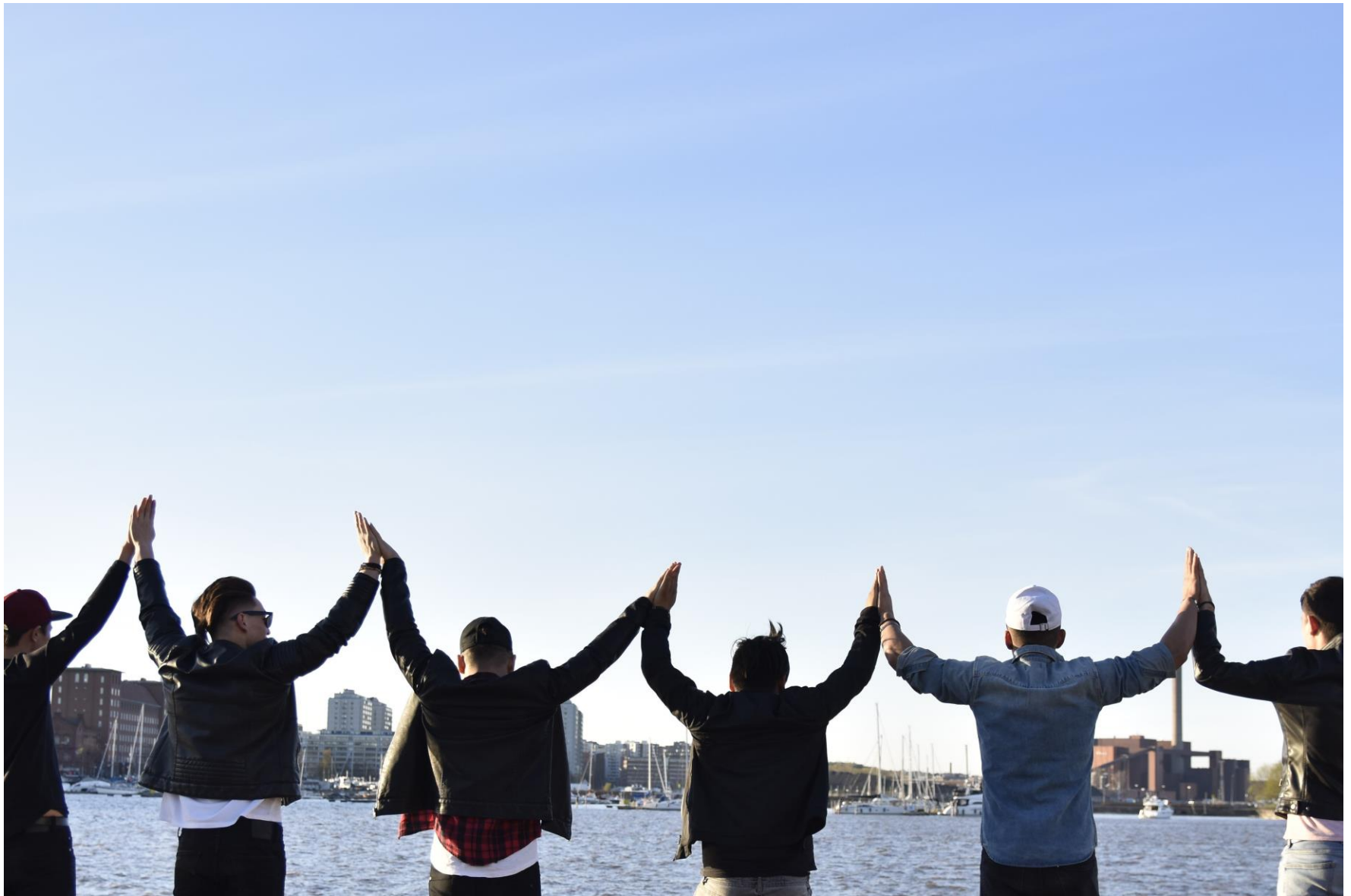
Kuva: Mosi Herati