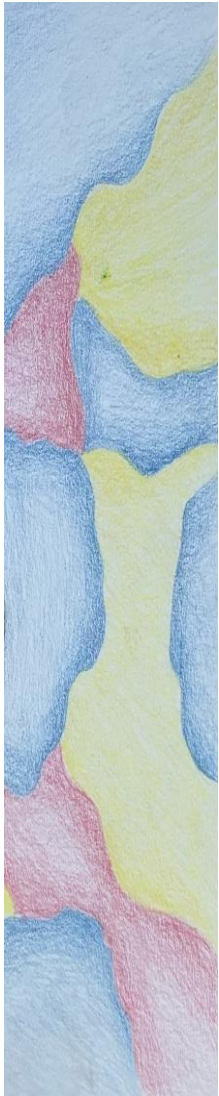
Kuvituskuva Julia Varala