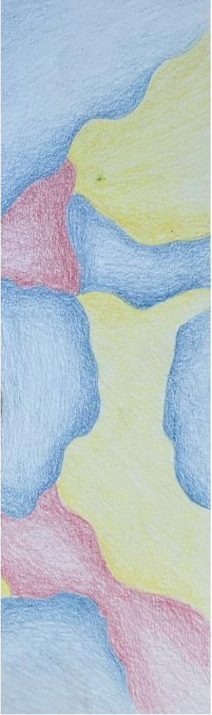
Kuvituskuva Julia Varala