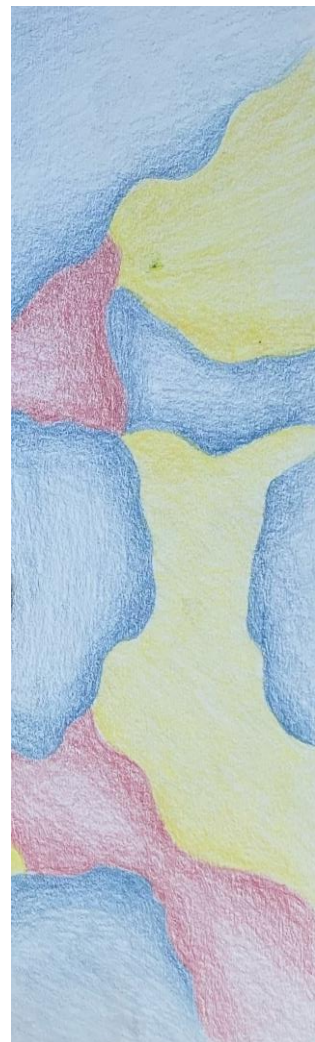
Kuvituskuva Julia Varala