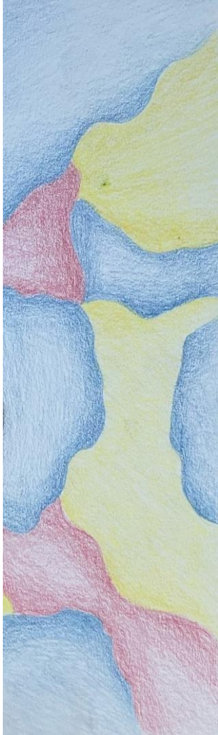
Kuvituskuva Julia Varala