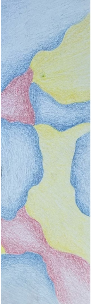
Kuvituskuva Julia Varala