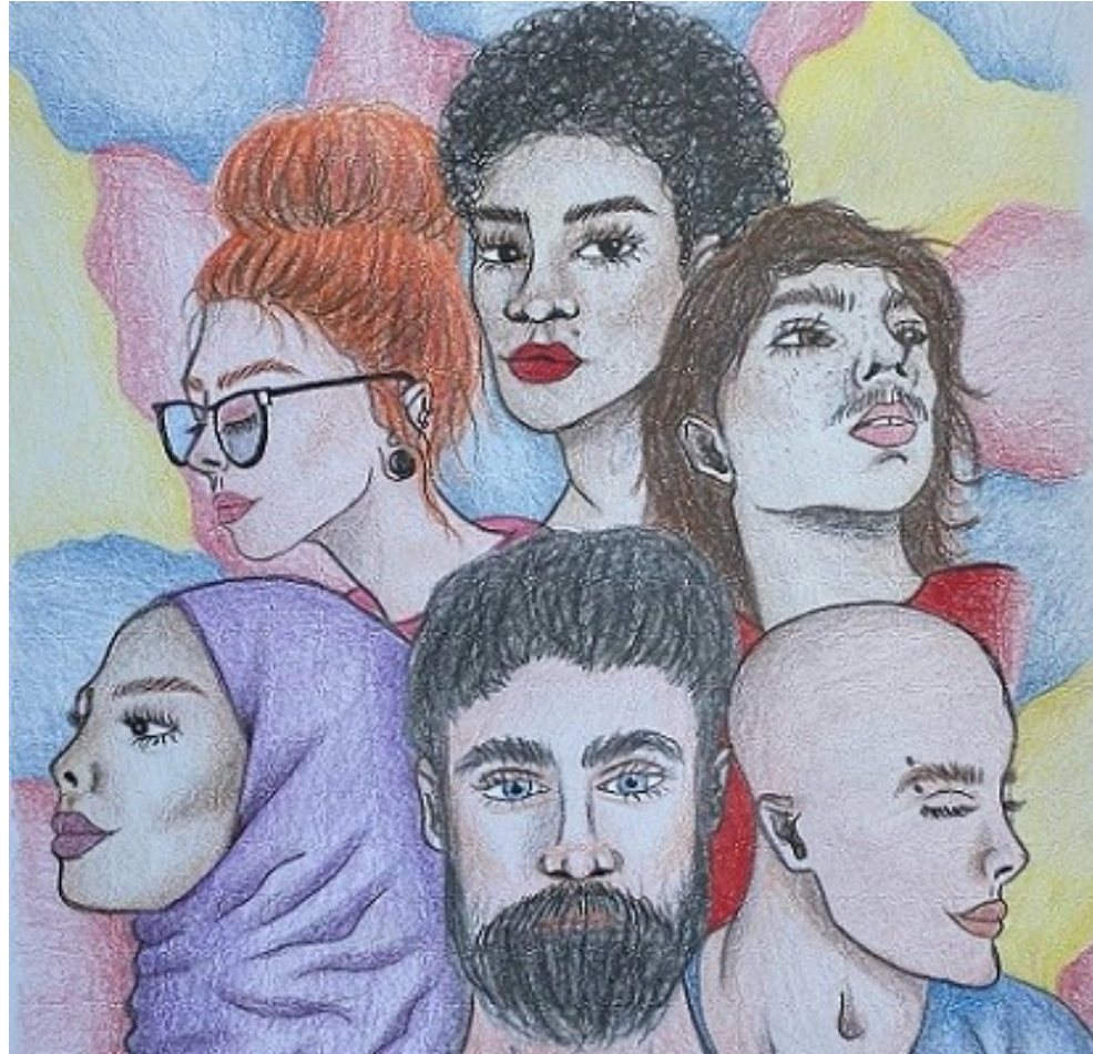
Kuvituskuva