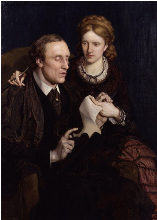
Ford Madox Brown: Henry Fawcett ja Dame Millicent Garrett Fawcett. The National Portrait Gallery.