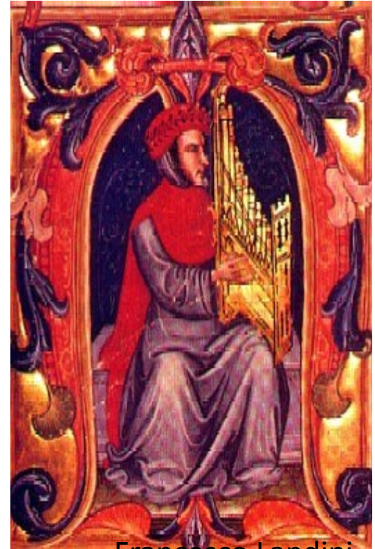
Francesco Landini, miniatyyri 1400-luvulta.