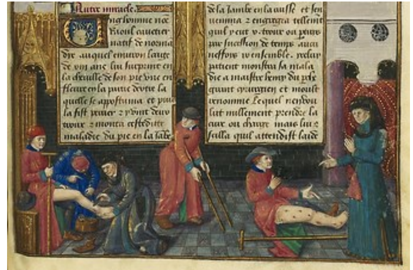
Le Livre des faiz monseigneur saint Loys, composé à la requête du cardinal de Bourbon et de la duchesse de Bourbonnois, 1400-l.: Pariisi, BNF, MS Fr. 2829, f. 89r