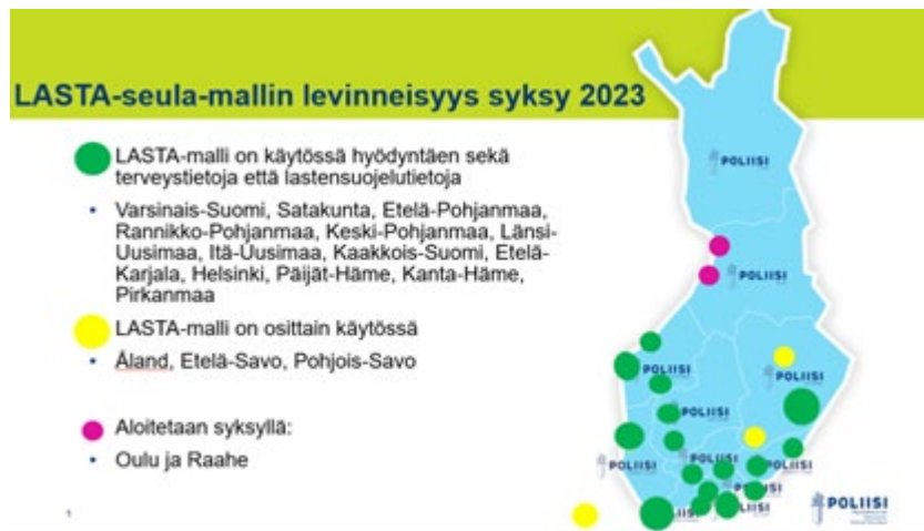
Kuva 2. LASTA-seula-mallin levinneisyys 2023

Lapsiin kohdistuneiden rikosten tutkinnassa moniammatilliset esiselvittelymallit mahdollistavat tapauksen kokonaisvaltaisen tarkastelun, jossa tulee huomioiduksi rikosvastuun tehokkaan toteutumisen ohella myös lapsen etu. Esitutkintayhteistyö, moniammatillinen yhteistyö sekä tutkinnanjohtajien ja tutkijoiden ja syyttäjien yhteiset koulutukset ja kokoontumiset vaikuttavat esitutkinnan ja tehtävän esitutkintayhteistyön laatuun ja tehokkuuteen, mitkä puolestaan edistävät rikosprosessin joutuisuutta.